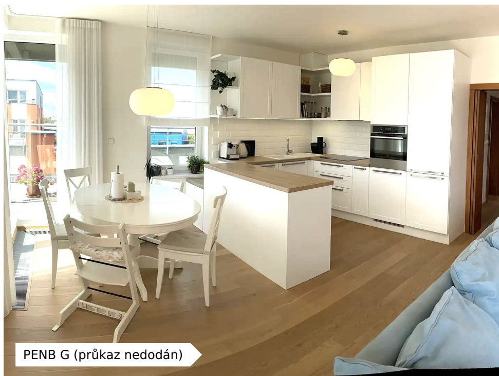
PENB G (průkaz nedodán)